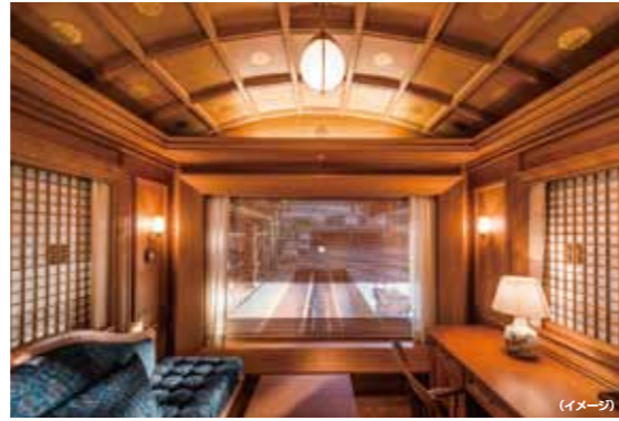
ラウンジカー「ブルームーン」

クルーズトレイン「ななつ星 in 九州」は木やファブリックを様々にあしらい、和洋・新旧融合の国内最上級の洗練された空間でみなさまをお迎えます。ラウンジカーにはバーカウンターを備え、ピアノの生演奏を聞きながらくつろげるソファや回転椅子などを配し、展望用に窓を大きく設えました。1両を2室にした「デラックススイート」、3室にした「スイート」のゆったりとした客室など、今までにない新しい列車の旅をお楽しみいただけます。